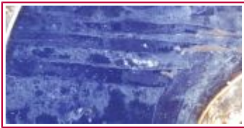
Imagen de visu

Causas múltiples: defectos de fabricación; falta de adherencia al sustrato; descohesión de la propia pintura.