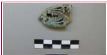
Imagen de visu

El análisis se realiza para identificar la sustancia negra superficial, previo a la limpieza y restauración de la pieza. Inicialmente se desconoce si la sustancia negruzca depositada en la superficie metálica es suciedad que se debe eliminar o si por el contrario es parte de la decoración de la pieza, y por tanto debe conservarse.