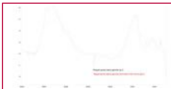
FTIR black deposit II