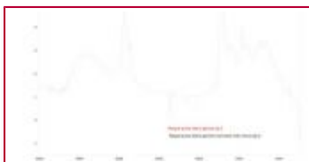
FTIR black deposit I